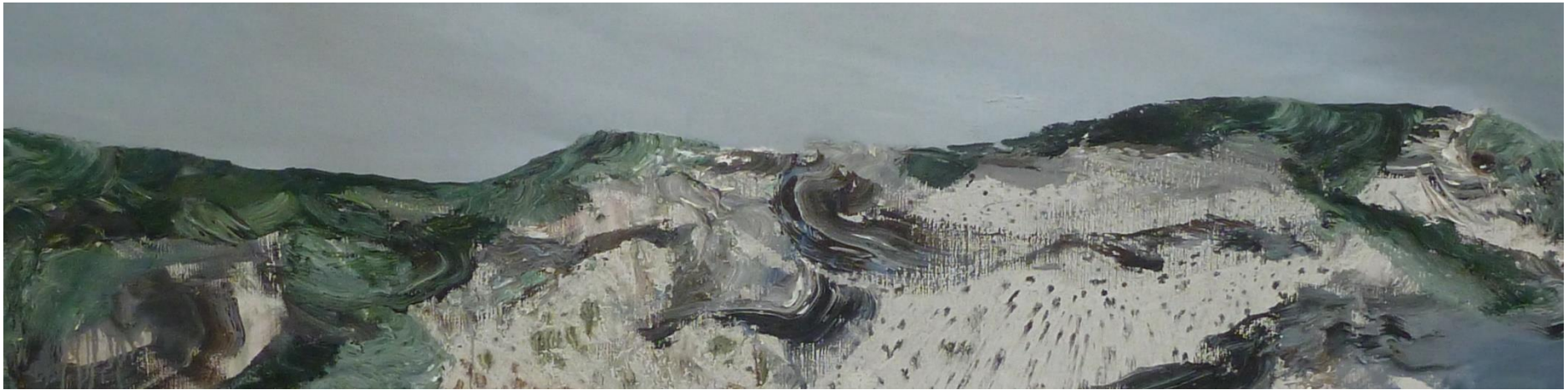
ANNE VANOUTRYVE, Glacier, 2011 olie/doek 40 x 160

Expo 'Transition' van Anne Vanoutryve in H8x12