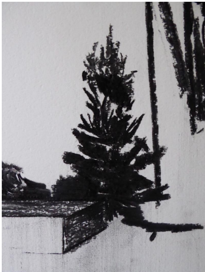
Anne Vanoutryve, Studie, 2017 houtskool/papier