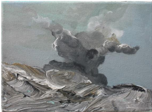
Anne Vanoutryve, Bombardement, 2015 olie/doek 13 x 18

In de landschappen uit de reeks World War series zien we het landschap dat brandt, verbrandt, ontploft, chemisch verwoest en verlaten, is. Af en toe duikt uit de lagen van de modder de figuratie op als lijkt de kunstenaar op zoek te gaan naar de resten van de verdoemde soldaat.