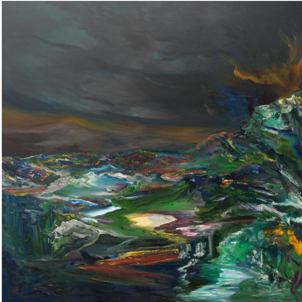
Anne Vanoutryve, 2058, 2016 olie/doek 180 x 180